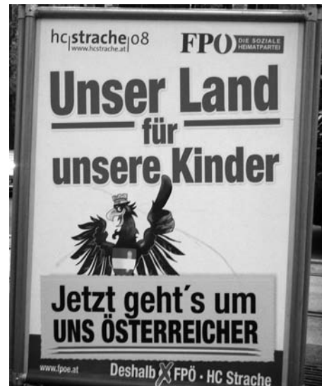
Wahlplakat der FPÖ