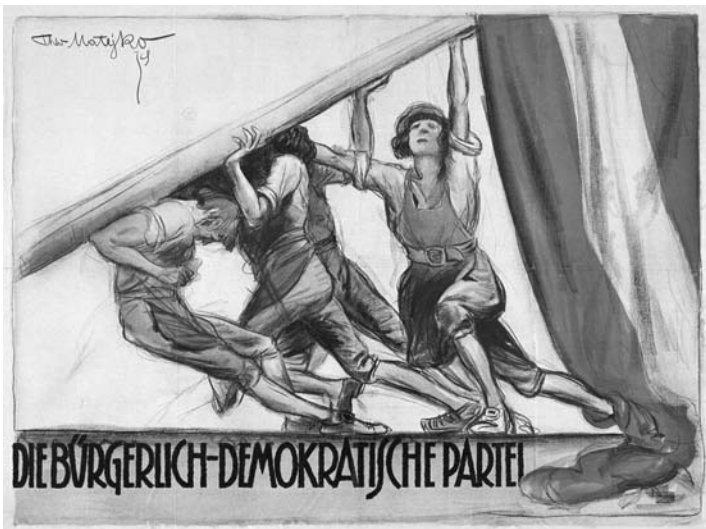
Plakat der bürgerlich-demokratischen Partei, Nationalratswahl 1919