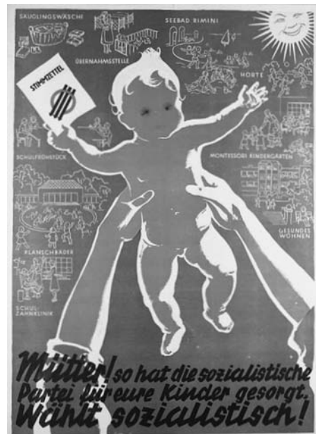
Wahlkampfplakat der SPÖ, Nationalratswahl 1945

Alle Plakate finden Sie in größerer Ansicht und in Farbe in der Onlineversion.