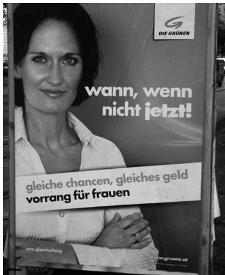
Wahlplakat der Grünen