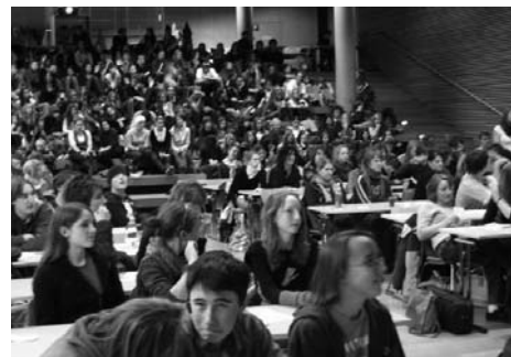
SchülerInnenparlament 2007