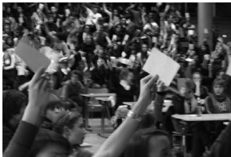
Abstimmung beim SchülerInnenparlament 2007