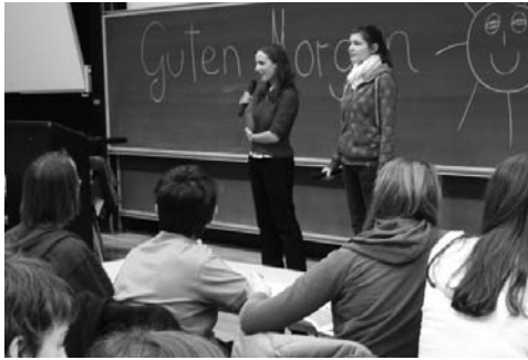
SchülerInnenparlament 2007

„Da ich die vorherigen SchülerInnenparlamente noch in Erinnerung hatte, wusste ich, wie wichtig es war, dass zu Themen gearbeitet wurde, die auch Interesse bei den SchülerInnen wecken.“