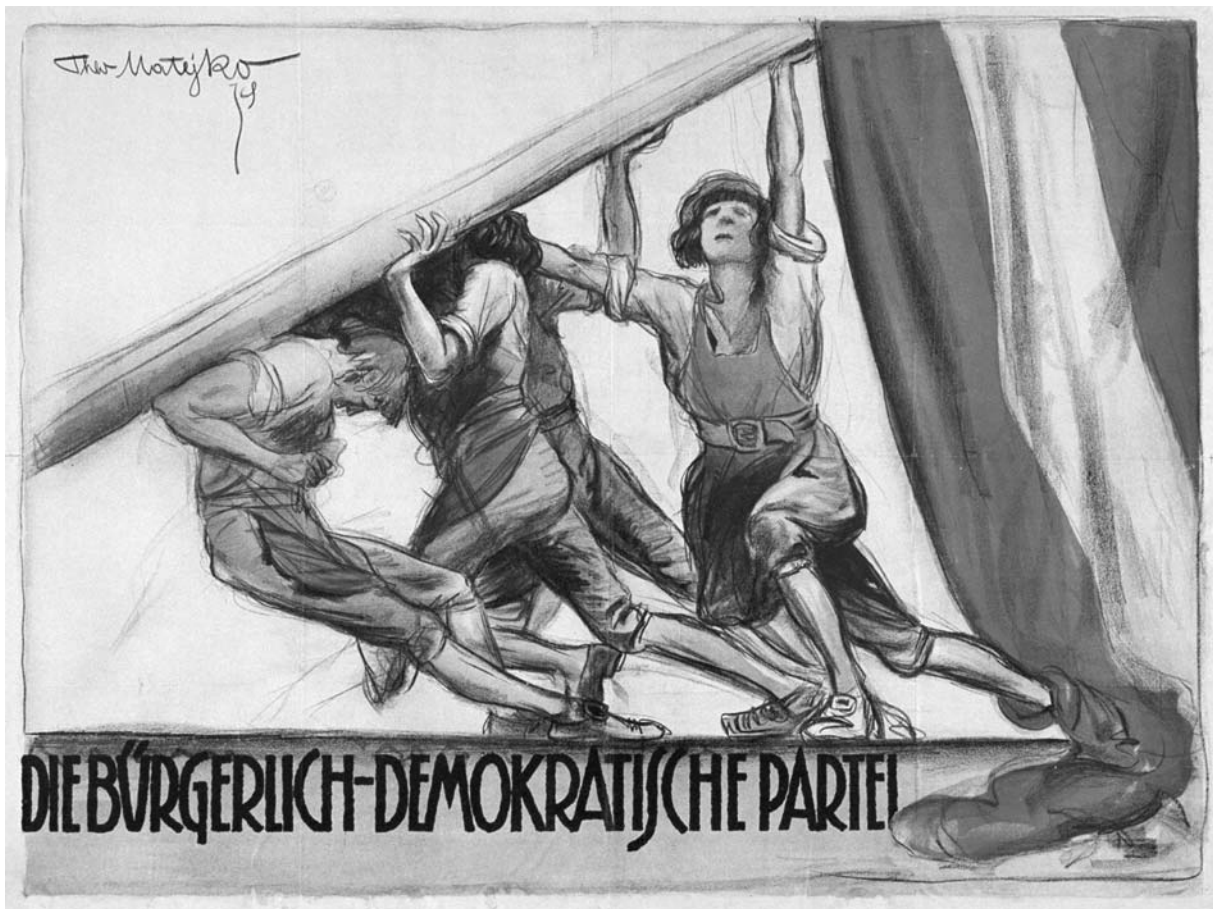
Plakat der bürgerlich-demokratischen Partei, Nationalratswahl 1919