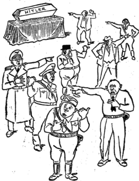
„Er hat mir's doch befohlen!“