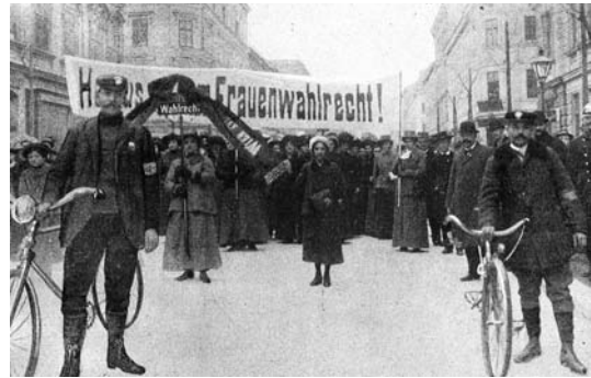
Demonstration der Sozialdemokratinnen für das Frauenwahlrecht in Wien.

Das nach dem Krieg nicht mehr auffaltbare Frauenwahlrecht führte aber nicht zu der von der Frauenbewegung, von den Frauen erhofften vollen Mitsprache in politischen Angelegenheiten. Insbesondere die bürgerliche Frauenbewegung sah sich im Parteienspektrum kaum bis gar nicht vertreten. Der Unmut auf Seiten der Frauen wurde nach den Wahlen 1927 noch einmal größer, nachdem von den bürgerlichen Parteien keine einzige Frau mehr für das Parlament an wählbarer Stelle nominiert wurde. Das war den Frauenbewegten, darunter der damaligen Grande Dame der bürgerlichen Frauenbewegung Marianne Hainisch, die zu diesem Zeitpunkt bereits über 80 Jahre alt war, dann doch zu viel: Am 24. April 1927 wurde in der Wiener Annagasse unter der Devise „Frauen Österreichs vereinigt euch!“ eine Versammlung abgehalten, in der u.a. Folgendes festgehal-