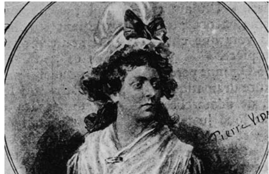
Olympe de Gouges (1748–1793) ergänzte 1791 die französische Erklärung der Menschen- und Bürgerrechte durch eine Erklärung der Frauenrechte. Sie wurde 1793 wegen ihrer Opposition gegen die Schreckensherrschaft Maximilien de Robespierres hingerichtet.

Das Ende des Ersten Weltkrieges 1918 brachte auch eine große Neuigkeit: Es konnte nicht mehr verhindert werden, dass nun auch Frauen zur Wahl zugelassen wurden, sie waren es, die in den vier schweren Jahren des Krieges die „Heimatfront“ gestellt hatten,