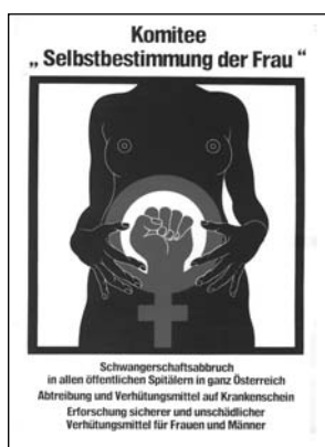
© STICHWORT. Archiv der Frauen- und Lesbenbewegung (Wien); Signatur: I P 178 „Mein Bauch gehört mir“. Plakat des Komitees „Selbstbestimmung der Frau“, 1979/80.