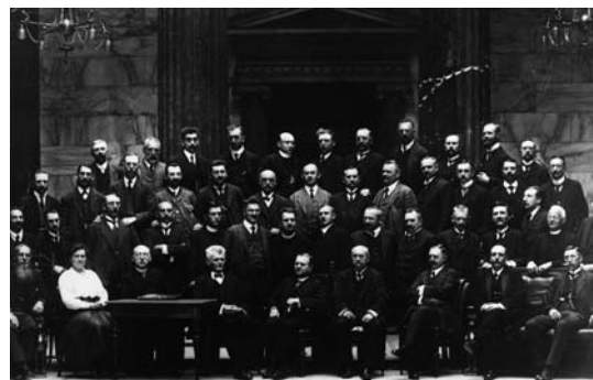
Hildegard Burjan – die einzige weibliche Abgeordnete der Christlich-Sozialen Partei in der Konstituierenden Nationalversammlung – mit christlich-sozialen Abgeordneten.