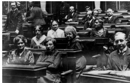
Die ersten weiblichen Abgeordneten der Sozialdemokratischen Arbeiterpartei in der Konstituierenden Nationalversammlung: Adelheid Popp, Anna Boschek, Gabriele Proft, Therese Schlesinger, Maria Tusch und Amalie Seidel (von vorne nach hinten)