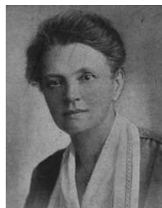
Olga Rudel-Zeynek

1927 Olga Rudel-Zeynek (Christlich-Soziale Partei) wird erste Präsidentin des Bundesrates: Sie ist damit weltweit die erste weibliche Präsidentin eines nationalen Parlaments.