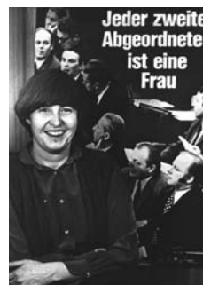
Quotenregelung. Frauenstaatssekretärin und spätere erste Frauenministerin Johanna Dohnal nimmt es anscheinend mit Humor, dass die geforderte Quotenregelung weit von der Realität entfernt ist, 1979.

1979 In Österreich beginnt 1979 die Institutionalisierung der Frauenpolitik: Bundeskanzler Bruno Kreisky erweitert seine Regierung um zwei Staatssekretariate für Frauenfragen (Staatssekretariat für allgemeine Frauenfragen im Bundeskanzleramt mit Johanna Dohnal (SPÖ) sowie das Staatssekretariat für Angelegenheiten der berufstätigen Frauen im Sozialministerium). 1983 wurde im Zuge der Koalitionsverhandlungen zwischen SPÖ und FPÖ das Staatssekretariat für die Angelegenheiten der berufstätigen Frauen wieder eingespart.