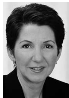
Barbara Prammer

2006 Barbara Prammer (SPÖ) wird Erste Präsidentin des österreichischen Nationalrats.