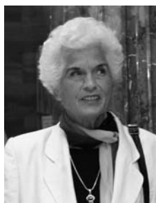
Freda Meissner-Blau