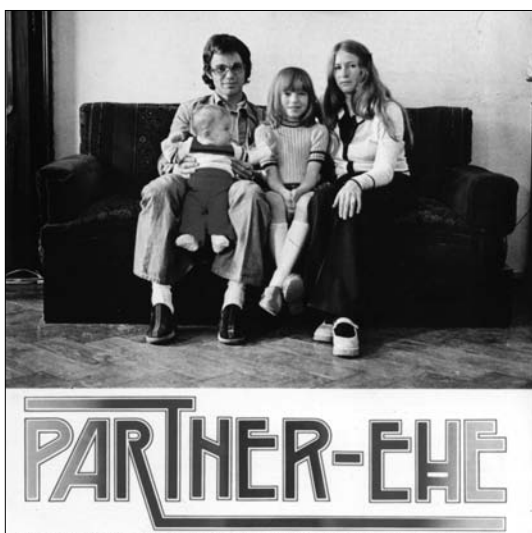
Quelle: Stiftung Bruno-Kreisky-Archiv, © „Solidarität“ (1976) Familienrechtsreform 1975. Die Gleichberechtigung von Mann und Frau in der Ehe wird 1975 gesetzlich verankert.