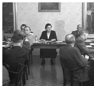
Zenzi Hölzl

1948 Zenzi Hölzl (SPÖ) wird die erste Bürgermeisterin österreichweit. Bis 1958 amtiert sie als Bürgermeisterin von Gloggnitz, Niederösterreich.