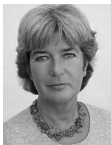
Heide Schmidt

1988 Erste Generalsekretärin einer politischen Partei: Heide Schmidt (FPÖ)