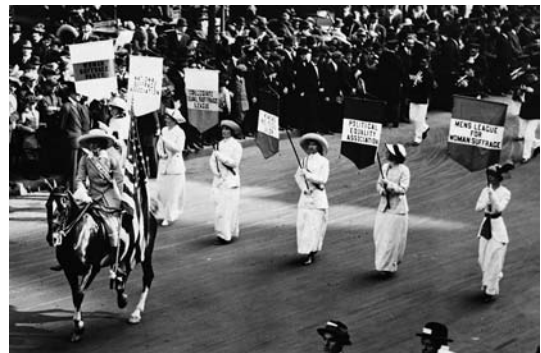
Am 31. Mai 1913 demonstrierten in New York Suffragetten für das Recht der Frauen, zu wählen.